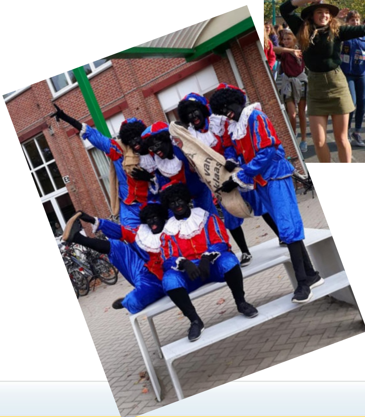
Ter gelegenheid van Sint-Maarten zorgen de pieten een hele dag voor animatie.