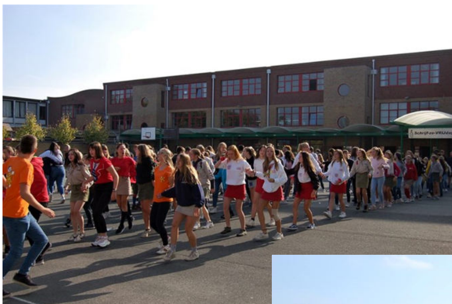
De leerlingenraad doet tijdens de middagpauze de hele school dansen tijdens de dag van de jeugdbeweging.