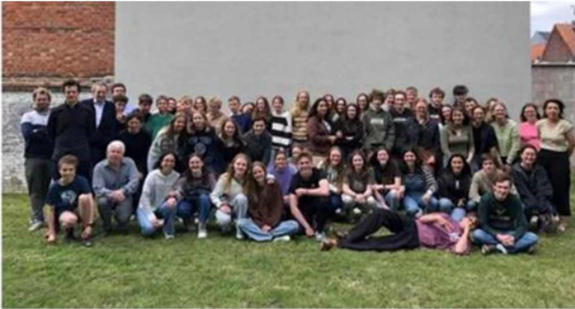
Meer dan 50 leerlingen volgen het vak Grieks bij VLOT!.